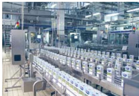
Мал. 157. Прадпрыемства «Савушкін прадукт», г. Брэст

малочныя заводы, масла-, сыраробныя і малочнакансервавыя заводы. Вытворцы натуральна-малочнай прадукцыі арыентуюцца на спажыўца ў буйных гарадах. Буйнейшымі прадпрыемствамі па вытворчасці неразведзенага малака з’яўляюцца «Савушкін прадукт» (Брэст), «Бабушкіна крынка» (Магілёў), камбінаты ў Гродне, Віцебску, Гомелі, Мінску (мал. 157). Сухое аб’ястлушчанае малако выпускаюць у Слоніме, п. г. т. Акцябрскі; малочныя кансервы — на малочнакансервавых камбінатах у Глыбокім і Рагачове. Ваўкавыскае прадпрыемства «Беллакт» выпускае малочныя прадукты для дзіцячага харчавання. Вытворчасць марожанага наладжана ў Брэсце, Мар’інай Горцы, Мінску, Пінску, масла і сыру — у Бярозе, Клецку, Кобрыне, Высокім, Верхнядзвінску.