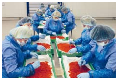
Мал. 158. Прадпрыемства «Санта-Брэмар», г. Брэст

Рыбная прамысловасць у якасці сыравіны выкарыстоўвае прывазную марскую рыбу і рыбу айчынных прыродных і штучных вадаёмаў. Перапрацоўкай марской рыбы і морапрадуктаў займаюцца больш за 15 прадпрыемстваў. Найбольш буйныя з іх — «Белрыба» (Мінск), «Санта-Брэмар» (Брэст) (мал. 158). Буйнейшыя цэнтры па выпуску рыбных кансерваў — Віцебск («Віцебскрыба»), Полацк («Сузор’е»), Браслаў («Браслаўрыба»), Нарач («Нарачанскі Рыбзавод»).