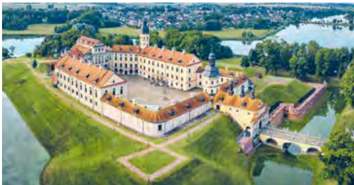
Мал. 56. Нясвіжскі палацава-паркавы ансамбль

Знайдзіце на карце атласа (с. 26) аб'екты матэрыяльнай і нематэрыяльнай Сусветнай спадчыны.