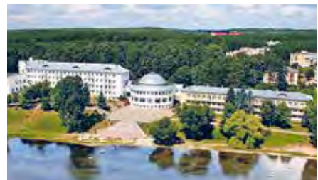
Мал. 55. Курорт «Нарач»

Найбольш вядомай у краіне і за яе межамі з'яўляецца курортная зона Нарачанскага рэгіёна, якая ўключае каля 20 аздараўленчых устаноў. Вакол возера Нарач размяшчаюцца санаторыі, дамы адпачынку, гасцінічныя комплексы (мал. 55).