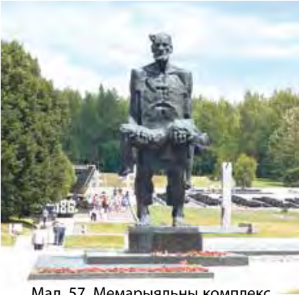
Мал. 57. Мемарыяльны комплекс «Хатынь»

Яшчэ 12 аб'ектаў маюць сусветнае значэнне: Камянецкая вежа, Спаса-Праабражэнская царква і Сафіійскі сабор у Полацку, Аўгустоўскі канал і інш. Шмат у краіне помнікаў, мемарыяльных комплексаў, звязаных з падзеямі Вялікай Айчыннай вайны. Найбольш вядомыя з іх «Брэсцкая крэпасць-герой», «Хатынь» (мал. 57) і інш. Матэрыяльныя аб'екты гісторыка-культурнай спадчыны нераўнамерна размяркоўваюцца па тэрыторыі Беларусі. У 13 самых «багатых» адміністрацыйных раёнах іх колькасць перавышае 35/1000 км 2 .