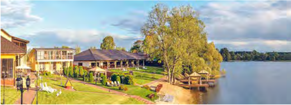
Мал. 54. Зона адпачынку «Браслаўскія азёры»

У лясных масівах, на маляўнічых берагах рэк, азёр і вадасховішчаў ствараюцца зоны адпачынку рэспубліканскага і мясцовага значэння. На тэрыторыі зон адпачынку рэспубліканскага значэння («Расоны», «Ула» і інш.) адначасова могуць адпачываць да 50 тыс. чалавек. Зонай адпачынку рэспубліканскага значэння з'яўляецца нацыянальны парк «Браслаўскія азёры». Прыгожыя азёры, хваёвыя лясы абумовілі стварэнне тут больш за 10 баз адпачынку і турысцкіх комплексаў (мал. 54). Буйная зона адпачынку «Вілейка» размешчана на пакрытых хваёвымі лясамі берагах Вілейскага вадасховішча.