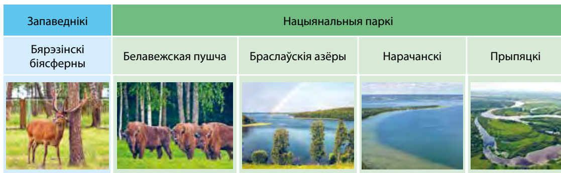
Мал. 62. Запаведнікі і нацыянальныя паркі Беларусі

падтрымліваецца толькі на тэрыторыі Бярэзінскага біясфернага запаведніка. У канцы XX ст. у Беларусі з’явіліся нацыянальныя паркі. Асноўныя іх задачы: захаванне ўнікальных прыродных комплексаў, правядзенне навуковых даследаванняў, рэкрэацыйная дзейнасць. У нацыянальных парках вылучаюцца зоны з рознай ступенню аховы. У цяперашні час у Беларусі чатыры нацыянальныя паркі: «Белавежская пушча», « Браслаўскія азёры », « Нарачанскі », « Прыпяцкі » (мал. 62). Сумарна запаведнікі і нацыянальныя паркі займаюць плошчу 475 тыс. га, або 2,3 % тэрыторыі краіны.