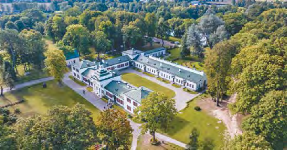
Мал. 63. Парк «Залессе» ў Смаргонскім раёне

Найбольш распаўсюджаны геалагічныя помнікі прыроды. Да іх адносяцца геалагічныя агаленні, берагавыя ўступы, буйныя валуны і іх групы, дзюны і інш. Часцей за ўсё яны прымеркаваны да паўночных і цэнтральных раёнаў краіны.