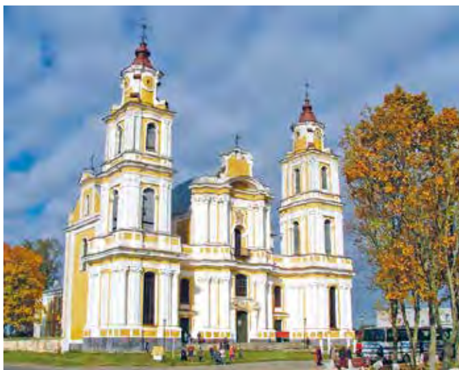
Мал. 85. Касцёл Унебаўззяцця Найсвяцейшай Панны Марыі ў аг. Будслаў