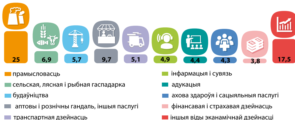
Мал. 89. Структура ВУП Беларусі па відах эканамічнай дзейнасці, 2024 г., %

Сфера паслуг у галіновай структуры прадстаўлена вялікай колькасцю відаў эканамічнай дзейнасці. Іх умоўна можна аб'яднаць у тры групы: