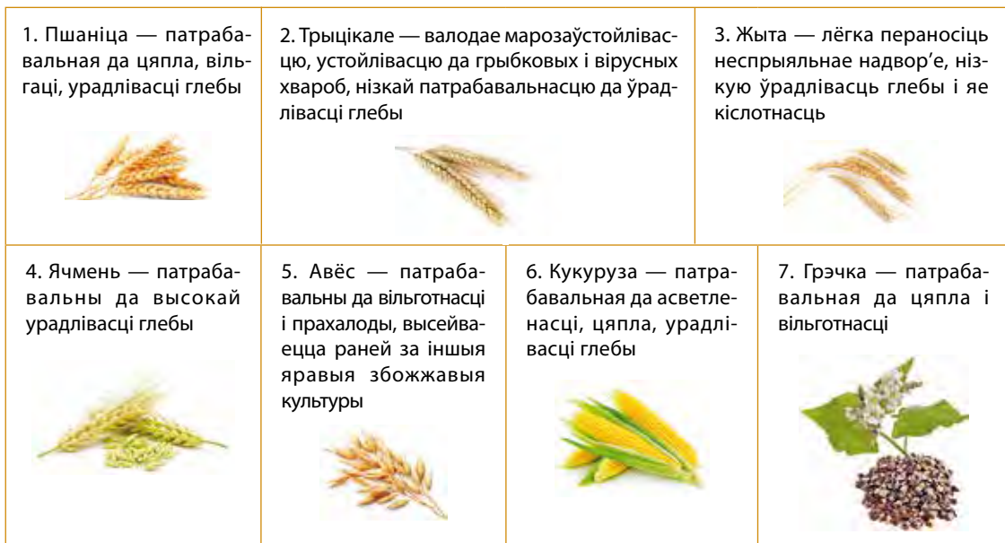
Мал. 90. Збожжавыя культуры, якія вырошчваюцца на тэрыторыі Беларусі

Самая каштоўная харчовая культура — пшаніца (мал. 90). Па плошчы пасаваў нязначна пераважае яравая пшаніца. У апошнія гады павялічыліся пасевы трыцікале, або пшанічна-жытняга гібрыда, які выкарыстоўваецца як харчовая і фуражная культура.