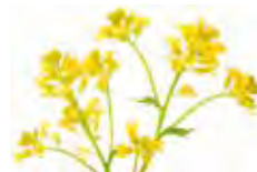
Мал. 92. Тэхнічныя культуры, якія вырошчваюцца на тэрыторыі Беларусі

Рапс — патрабавальная да вільгаці і ўрадлівасці глебы, холадаўстойлівая культура