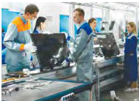
Мал. 115. На прадпрыемстве «Гарызонт»

Важнае значэнне мае вытворчасць тэлевізараў, якая сканцэнтравана на двух прадпрыемствах: «Гарызонт» у Мінску і «Віцязь» у Віцебску (мал. 115). Разнастайную электронную прадукцыю выпускае «Інтэграл».