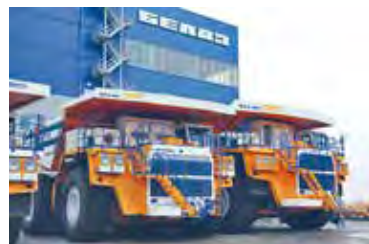
Мал. 109. Прадпрыемства «БелАЗ», г. Жодзіна

Адным з найбуйнейшых у свеце вытворцаў кар’ерных самазвалаў вялікай грузападымальнасці з’яўляецца прадпрыемства «БелАЗ» (мал. 109, 110). На БелАЗе выпушчаны ўзоры кар’ерных самазвалаў грузападымальнасцю 90 т на акумулятарных батэрэях, наладжаны выпуск кар’ерных самазвалаў грузападымальнасцю 450 т. Кар’ерны самазвал серыі 7513 узнагароджаны ў 2025 г. Дзяржаўным знакам якасці.