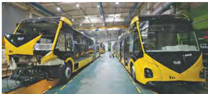
Мал. 111. На прадпрыемстве «БЕЛДЖЫ», аг. Перасады Барысаўскага раёна