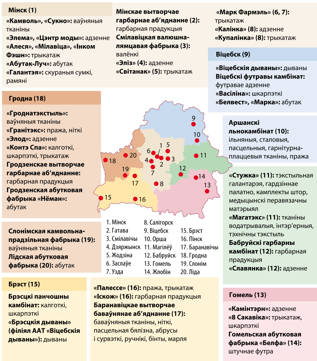
Мал. 130. Прадпрыемствы лёгкай прамысловасці Беларусі

прадпрыемствы размешчаны ў Магілёве, Віцебску (мал. 130). З розных відаў хімічных і натуральных валокнаў вырабляюць змяшаныя тканіны.