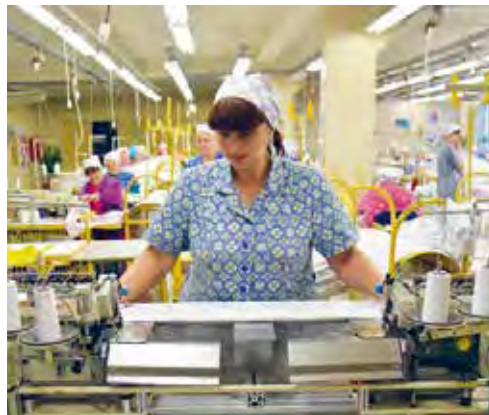
Мал. 129. На Баранавіцкім вытворчым баваўняным аб'яднанні

Асноўныя цэнтры вытворчасці ваўняных тканін: Гродна, Мінск, Слонім. Дываны вырабляюць у Віцебску і Брэсце. У апошнія гады назіраецца скарачэнне выпуску ваўняных тканін. Раней іх выраблялі з прывазнай сыравіны. Цяпер акрамя прывазнай тонкай мерыносавай воўны выкарыстоўваюць лаўсан, нітрон, ільняныя валокны.