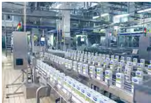
Мал. 132. На прадпрыемстве «Савушкін прадукт», г. Брэст

Найбуйнейшымі прадпрыемствамі па вытворчасці цэльнага малака