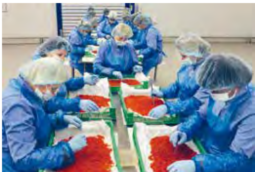
Мал. 133. На прадпрыемстве «Санта-Брэмар», г. Брэст

У 2025 г. прадукцыя Рагачоўскага малочна-кансервавага камбіната (згущанае малако), прадпрыемстваў «Беллакт» (сухія малочныя сумесі для дзіцячага харчавання), «Савушкін прадукт» (сыр цвёрды «Брэст-Літоўск») адзначаны Дзяржаўным знакам якасці.