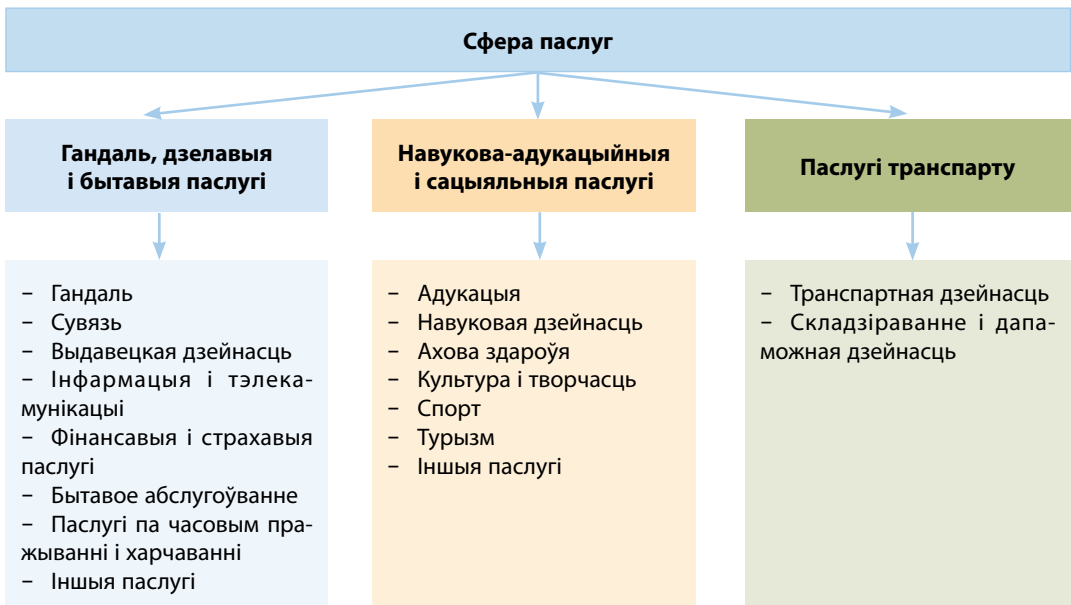
Мал. 134. Структура сферы паслуг

Важную ролю ў сферы паслуг традыцыйна адыгрываюць размеркавальныя паслугі — транспарт і гандаль. У цяперашні час яны істотна змяніліся: пераўтвораны структуры перавозак, створаны лагістычныя цэнтры, арганізаваны сеткавы гандаль і г. д. У эпоху НТР у сусветнай гаспадарцы з'яўляюцца якасна новыя віды паслуг: інфармацыйна-камунікацыйныя, навукова-даследчыя, банкаўскія і фінансавыя, турысцкія і інш. У Беларусі актыўна ўкараняюцца сучасныя касмічныя тэхналогіі.