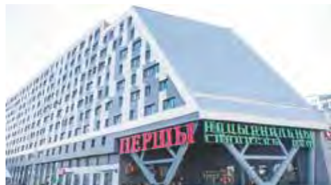
Мал. 135. Першы Нацыянальны гандлёвы дом

У 2023 г. у Мінску адкрыты гандлёвы цэнтр «Першы Нацыянальны гандлёвы дом». Гэта першы гандлёвы праект, у якім прадстаўлена прадукцыя найлепшых айчынных вытворцаў — брэндаў г. Мінска і ўсіх абласцей краіны (мал. 135).