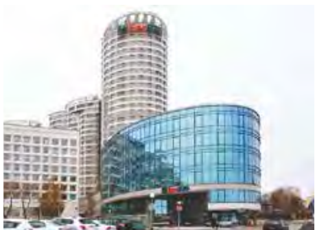
Мал. 136. «Банк БелВЭБ», г. Мінск

На тэрыторыі Беларусі дзейнічае больш за 20 банкаў і крэдытна-фінансавых арганізацый, якія маюць права на ажыццяўленне банкаўскіх аперацый. Найбуйнейшыя сярод іх — «Беларусбанк», «Белаграпрамбанк», «Сбер Банк» і інш.