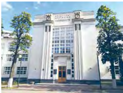
Мал. 138. Будынак навучальнага корпуса факультэта географіі і геаінфарматыкі БДУ, г. Мінск

Спецыялістаў больш высокай кваліфікацыі рыхтуюць установы сярэдняй спецыяльнай адукацыі. Яны прадстаўлены 224 разнапрофільнымі каледжамі. Больш за ўсё сярэдніх спецыяльных каледжаў у Мінску, дзе прадстаўлены амаль усе профілі. Шмат каледжаў у Гомелі, Гродне, Віцебску, Бабруйску і Магілёве. Кожны трэці навучэнец асвойвае спецыяльнасць тэхнічнага профілю, кожны шосты — эканамічнага і юрыдычнага профілю. Спецыяльнасці, звязаныя з сельскай гаспадаркай, атрымліваюць 11,3 % навучэнцаў.