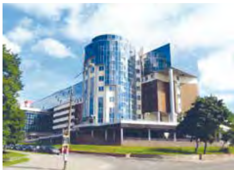
Мал. 139. 2-я гарадская клінічная бальніца, г. Мінск

Дзякуючы клопату дзяржавы ўстановы аховы здароўя аснашчаны сучасным абсталяваннем. У медыцынскую практыку ўкараняюцца новыя ўнікальныя тэхналогіі. У Беларусі паспяхова функцыянуюць РНПЦ, якія шырока вядомыя ва ўсім свеце («Маці і дзіця», «Кардыялогія», неўралогіі і нейрахірургіі, траўматалогіі і артапедыі і інш.). Цэнтры аказваюць медыцынскія паслугі грамадзянам як Беларусі, так і замежных краін, што пацвярджае высокі ўзровень медыцыны ў краіне.