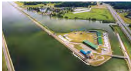
Мал. 156. Вяслярны канал у Заслаўі

У Мінскай вобласці размешчаны Нясвіжскі замак — цэнтр турызму і адпачынку міжнароднага значэння, помнік Сусветнай спадчыны ЮНЕСКА. Прыцягваюць турыстаў і спартыўныя аб'екты: гарналыжныя цэнтры «Сілічы» і «Лагойск», цэнтр зімовых відаў спорту ў Раўбічах, вяслярны канал у Заслаўі (мал. 156), футбольны стадыён «Барысаў-Арэна».