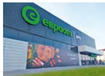
Рис. 161. Торговая сеть «Евроопт»

В Беларуси быстрыми темпами развивается сетевая торговля, появляются такие торговые сети, как «Евроопт», «Белмаркет», «Гиппо», «Виталюр», «ОМА», «Мила», «5 элемент» и др. Они, как правило, концентрируются в крупных городах с большей покупательской способностью. Но в последние годы сетевая торговля охватывает и сельскую местность, где сеть «Евроопт» открыла уже более 700 магазинов (рис. 161). В сетевых магазинах продаются как продовольственные, так и промышленные товары.