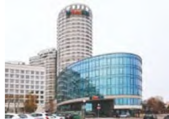
Рис. 162. Здание «Банк БелВЭБ», г. Минск

В стране появилось большое количество холдинговых и трастовых компаний, инвестиционных фондов и других организаций, оказывающих финансовые услуги. На рубеже XX и XXI вв. в стране образовались банки, оказывающие финансовые услуги в различных сферах деятельности. Центральным банком и государственным органом Республики Беларусь выступает Национальный банк, который подотчётен только Президенту страны. Данный банк регулирует кредитные и денежные отношения в стране, обеспечивает функционирование её банковской системы. На территории Беларуси действует 28 банков и кредитно-финансовых организаций, имеющих право на осуществление банковских операций. Крупнейшие среди них — «Беларусбанк», «Белинвестбанк», «Белагропромбанк» и др. Банками предоставляются кредиты для осуществления различных экономических и социальных проектов. В последние годы растёт инвестиционная привлекательность Республики Беларусь, увеличивается число банков с участием иностранного капитала. Лидерами среди них являются «Приорбанк», «Банк БелВЭБ» (рис. 162).