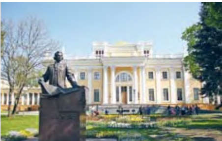
Рис. 176. Гомельский дворцово-парковый комплекс

Крупнейшие экономические центры области. Гомель — крупнейший промышленный и культурный центр области. Он имеет периферийное положение и расположен на востоке области на реке Сож. Город основан в XII в., сейчас является вторым в стране по численности населения (535,7 тыс. жителей). В городе более 100 промышленных предприятий, которые специализируются на машиностроении и металлообработке, химической промышленности. Крупнейшие предприятия города — «Гомсельмаш» и Гомельский химический завод. Какую продукцию они выпускают? Также в городе производятся обои, мебель, листовое стекло, продукция пищевой