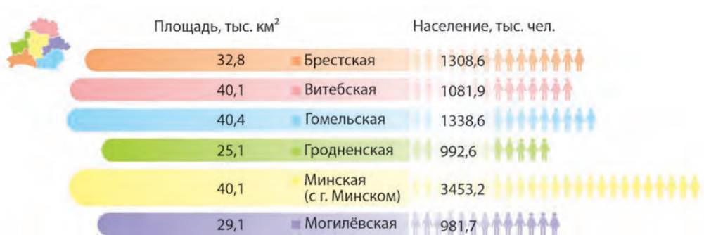
Рис. 6. Площадь (тыс. км 2 ) и население (тыс. чел.) областей Беларуси на 01.01.2024

3. Современное административно-территориальное деление. Современное АТД Беларуси включает следующие единицы: область — район — сельсовет (горсовет). В Беларуси выделяется шесть областей: Брестская, Витебская, Гомельская, Гродненская, Могилёвская и Минская. Площади областей в последнее время не изменяются и составляют от 25,1 тыс. км 2 (Гродненская) до 40,4 тыс. км 2 (Гомельская) (рис. 6).