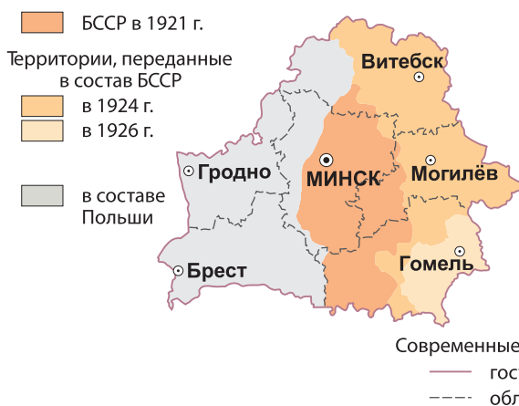
Рис. 4. Территория Беларуси в 1920-х гг.

В 1945 г. 18 районов Белостокской и Брестской областей были переданы Польше (рис. 5). Последнее уточнение границ между Смоленской и Могилёвской областями произошло в 1964 г., после чего государственные границы Беларуси не изменялись.