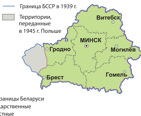
Рис. 5. Территория Беларуси в 1930–1940-х гг.