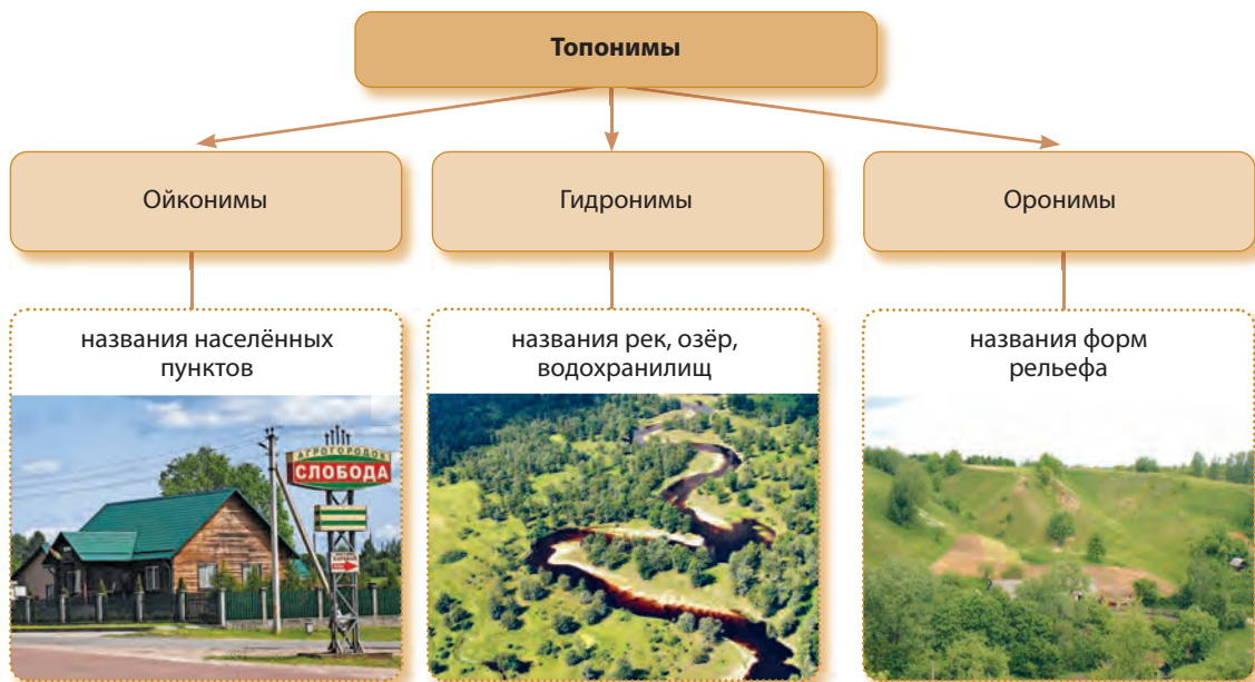
Рис. 11. Группы топонимов

ойконимы, гидронимы и оронимы (рис. 11). К ойконимам (греч. oikos — ‘жильё’) относятся названия населённых пунктов; к гидронимам (греч. hydor — ‘вода’) — рек, озёр; к оронимам (греч. oros — ‘гора’) — форм рельефа. По общему количеству в Беларуси наибольшее распространение получили гидронимы и ойконимы.