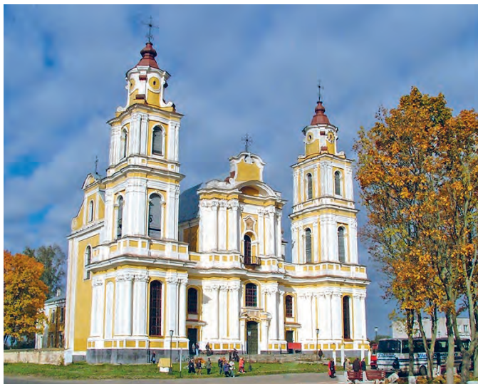
Рис. 85. Костёл Успения Пресвятой Девы Марии в аг. Будслав