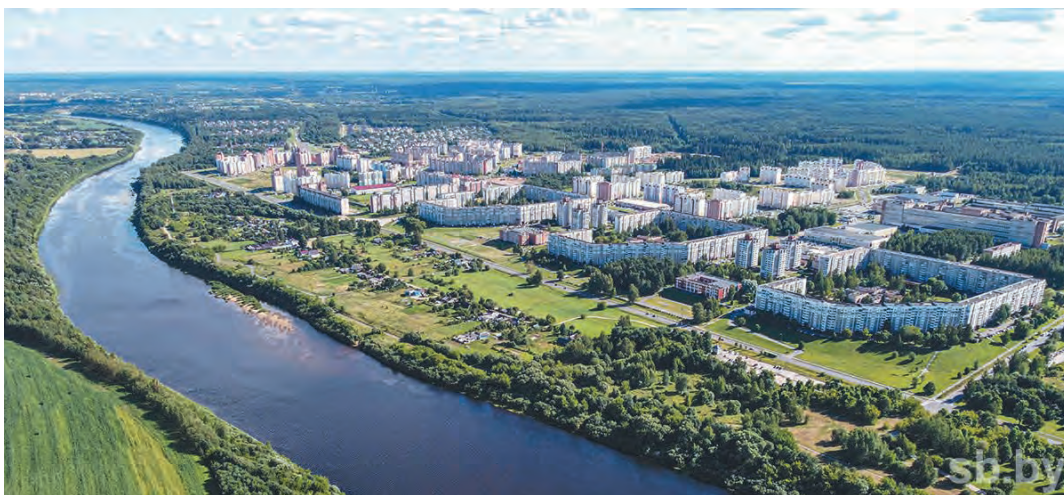
Рис. 86. Город Новополоцк

В нашей стране единственным городом-миллионером является столица — город Минск. Численность жителей в Минске составляет 1995 тыс. чел. К категории крупнейших городов относится Гомель (502 тыс. чел.), а остальные областные центры и некоторые районные ( Бобруйск , Барановичи , Борисов , Мозырь , Лида , Молодечно и др.) — крупные города.