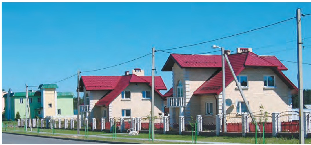
Рис. 87. Агрогородок Томашовка в Брестском районе

Сельское расселение характеризуется двумя показателями: 1) людностью, или величиной населённых пунктов по количеству жителей, и 2) густотой сельских поселений в расчёте на 100 км 2 . Первый из них на территории Беларуси в направлении с севера на юг возрастает, а второй, наоборот, уменьшается.