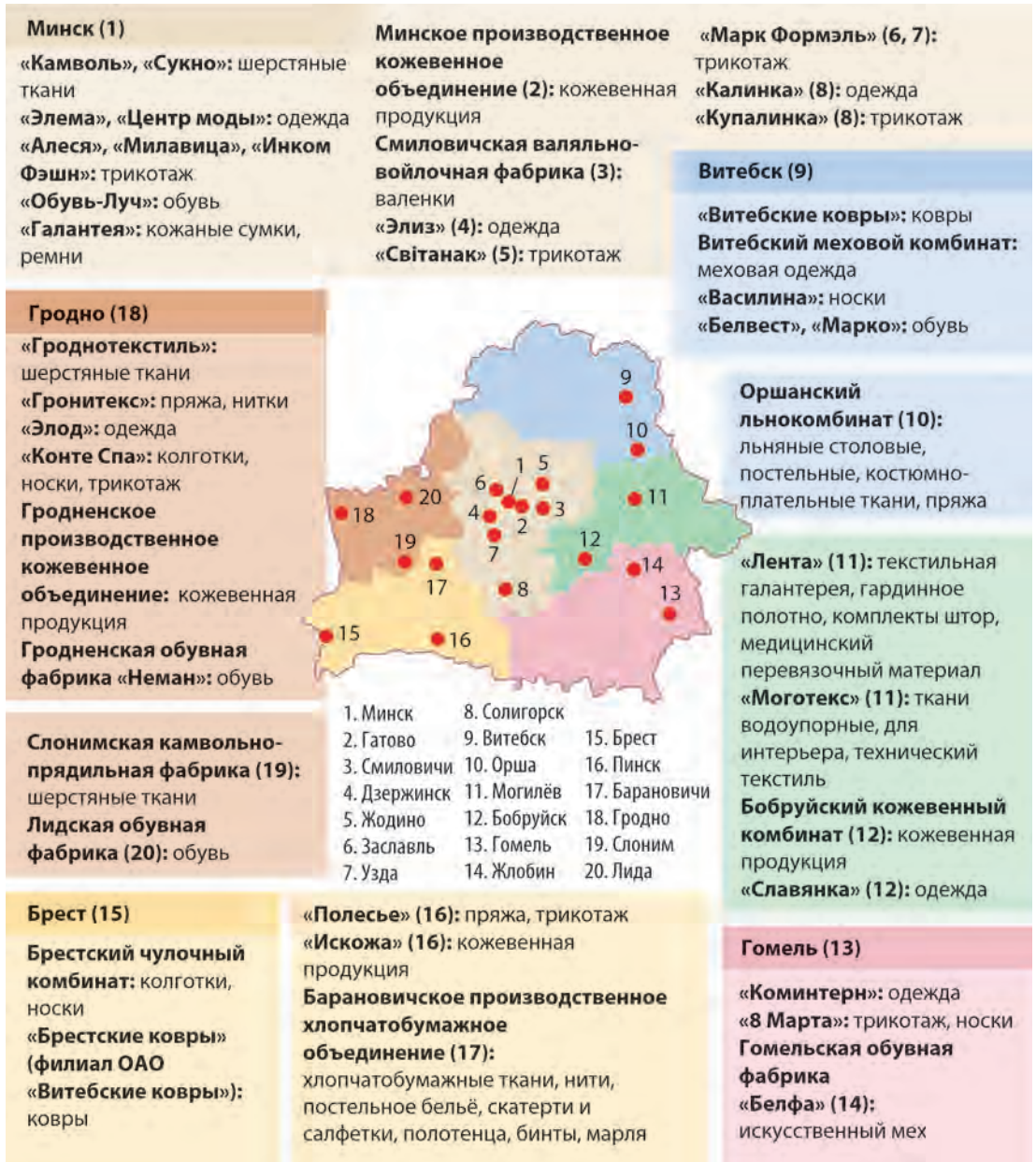
Рис. 130. Предприятия лёгкой промышленности Беларуси

Крупнейшие предприятия размещены в Могилёве, Витебске (рис. 130). Из различных видов химических и натуральных волокон производят смешанные ткани.