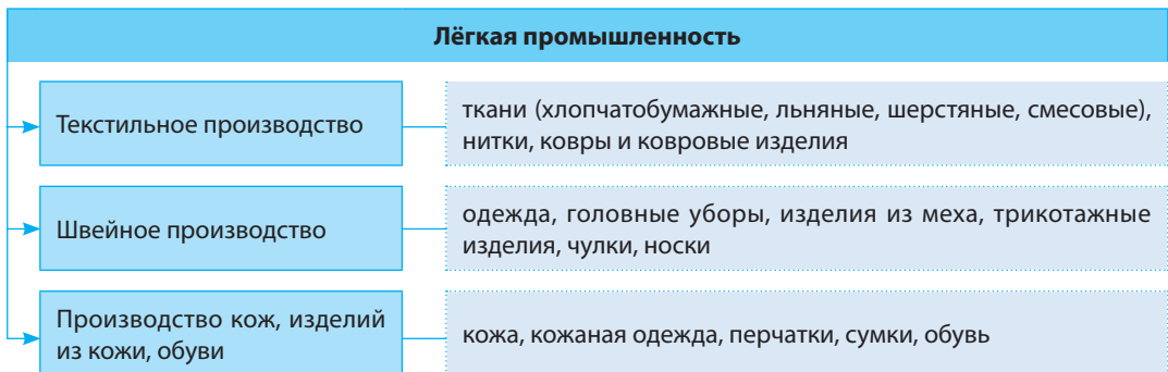
Рис. 128. Структура лёгкой промышленности

Почему выгодное экономическое положение является важным фактором для развития лёгкой промышленности в Беларуси?