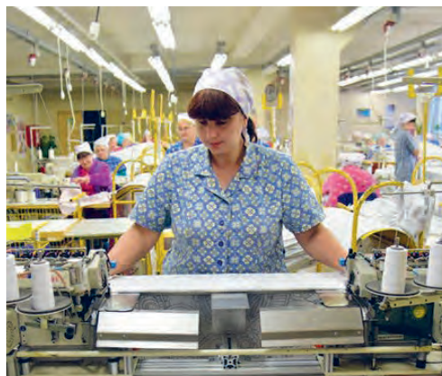
Рис. 129. На Барановичском производственном хлопчатобумажном объединении

Из каких стран в Республику Беларусь завозится хлопок?