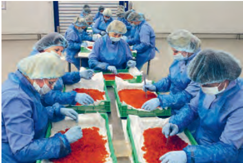
Рис. 133. На предприятии «Санта-Бремор», г. Брест

В 2025 г. продукция Рогачёвского молочноконсервного комбината (сгущённое молоко), предприятий «Беллакт» (сухие молочные смеси для детского питания), «Савушкин продукт» (сыр твёрдый «Брест-Литовск») отмечены Государственным знаком качества.