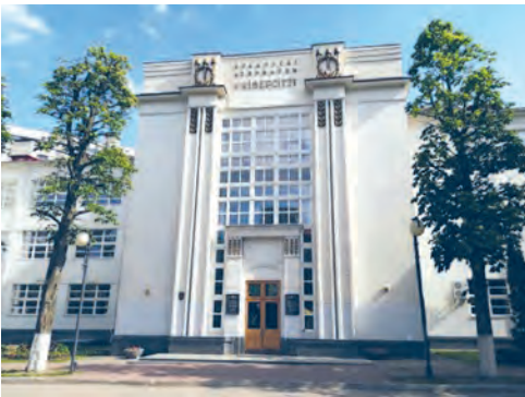
Рис. 138. Учебный корпус факультета географии и геоинформатики БГУ, г. Минск

Специалистов более высокой квалификации готовят учреждения среднего специального образования. Они представлены 224 разнопрофильными колледжами. Больше всего колледжей в Минске, где представлены почти все профили. Много колледжей в Гомеле, Гродно, Витебске, Бобруйске и Могилёве. Каждый третий учащийся осваивает специальность технического профиля, каждый шестой — экономического и юридического профиля. Специальности, связанные с сельским хозяйством, получают 11,3 % учащихся.