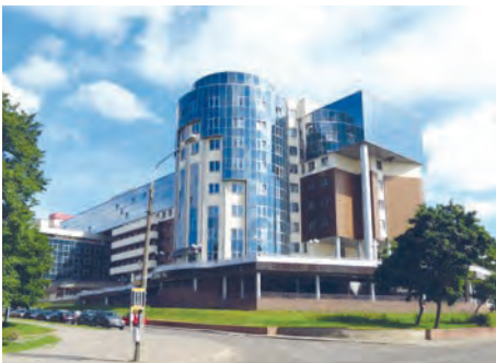
Рис. 139. 2-я городская клиническая больница, г. Минск

Благодаря заботе государства учреждения здравоохранения оснащены современным оборудованием. В медицинскую практику внедряются новые уникальные технологии. В Беларуси успешно функционируют РНПЦ, которые широко известны во всём мире («Мать и дитя», «Кардиология», неврологии и нейрохирургии, травматологии и ортопедии и др.). Центры оказывают медицинские услуги как гражданам Беларуси, так и иностранцам, что подтверждает высокий уровень медицины в стране.