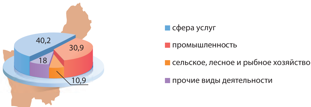
Рис. 153. Структура ВРП Гродненской области, 2023 г., %

5. Промышленность. На долю промышленности приходится 30,9 % ВРП (рис. 153). В Гродненской области работает более 1300 предприятий. В структуре обрабатывающей промышленности ведущую роль играют пищевая и химическая промышленность.