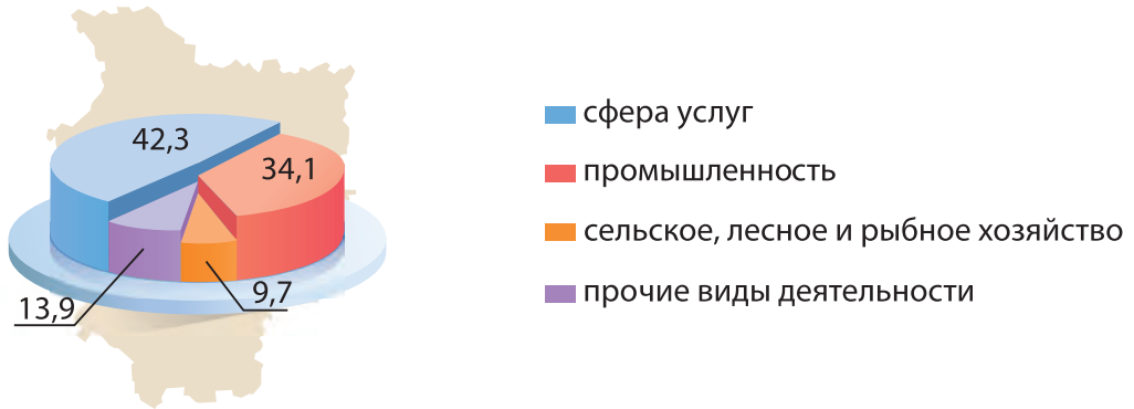
Рис. 155. Структура ВРП Минской области, 2023 г., %

В области развито машиностроение. Производится почти 100 % самосвалов (Жодино), выпускаются электрические приборы.