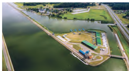
Рис. 156. Гребной канал в Заславле

В Минской области расположен Несвижский замок — центр туризма и отдыха международного значения, памятник Всемирного наследия ЮНЕСКО. Привлекают туристов и спортивные объекты: горнолыжные центры «Силичи» и «Логойск», центр зимних видов спорта в Раубичах, гребной канал в Заславле (рис. 156), футбольный стадион «Борисов-Арена».