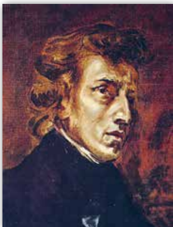
Эжэн Дэлакруза. Фрыдэрык Шапэн (1838 г.)

Рамантычныя мініяцюры. Сваёй музыкай кампазітары-рамантыкі пратэставалі супраць устояў грамадства, якія скоўвалі свабоду мастака. Недасяжны, з іх пункту гледжання, ідэал яны бачылі за межамі рэчаіснасці. Адсюль у музычным мастацтве атрымалі развіццё тэмы духоўнай адзіноты, няўхільнасці лёсу, лірычнай споведзі... Найбольш поўна яны былі ўвасоблены ў жанры музычнай мініяцюры* , які дазваляў адлюстраваць неабсяжнае ў адным мімалётным імгненні.