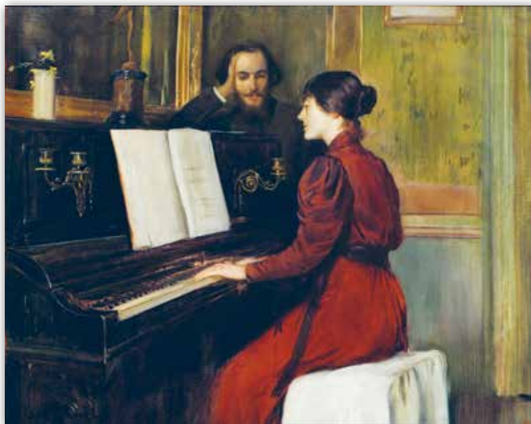
Санцьяга Русіньёл. Раманс (1894 г.)

У сусветна вядомым рамансе «Салавей» Аляксандра Аляб'ева атрымаў увасабленне вобраз невялікай птушчкі, майстэрства і прыгажосць спеваў якой