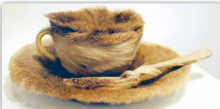
Мерыт Опенгейм. Футравы чайны прыбор (1936 г.)

У мастацтве сюррэалізму вылучаюцца два кірункі. Прадстаўнікі першага з іх прадоўжылі праводзіць яркія мастацкія акцыі, уключыўшыся ў гульню, прапанаваную дадаістамі (прачытайце тэкст у рубрыцы «Вазьміце на заметку» на с. 83). З дапамогай «ready-made» яны прапаноўвалі публіцы вобразна асэнсаваць прыгажосць прадметаў, вырабленых заводскім спосабам. Майстры камбінавалі розныя матэрыялы, формы для канструявання прадметаў з