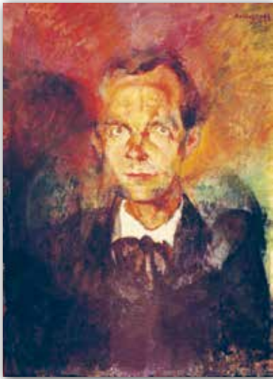
Роберт Берані. Партрэт Бэлы Бартака, выкананы ў стылістыцы экспрэсіянізму (1913 г.)

бянтэжыла людзей незвычайным напорам. Не-выпадкова крытыкі называлі творчасць Бэлы Бартака і іншых кампазітараў-экспрэсіяністаў «бунтам супраць традыцыйных поглядаў на музычнае мастацтва».