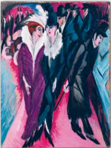
Эрнст Людвіг Кірхнер. Вуліца Берліна (1913 г.)

ціну жыцця. Больш за ўсё яны звярталі ўвагу на ўтоеныя жыццёвыя эпізоды, калі за прыгажосцю і вытанчанай узвышанасцю вобразаў крыецца непраўдзівае адлюстраванне фактаў. Таму героямі мастацкіх твораў экспрэсіяністаў сталі людзі, якія жывуць у нястачы і заклікаюць да міласэрнасці. Так мастакі перадавалі душэўны боль чалавека, які шукае дапамогі ў няправедным свеце.