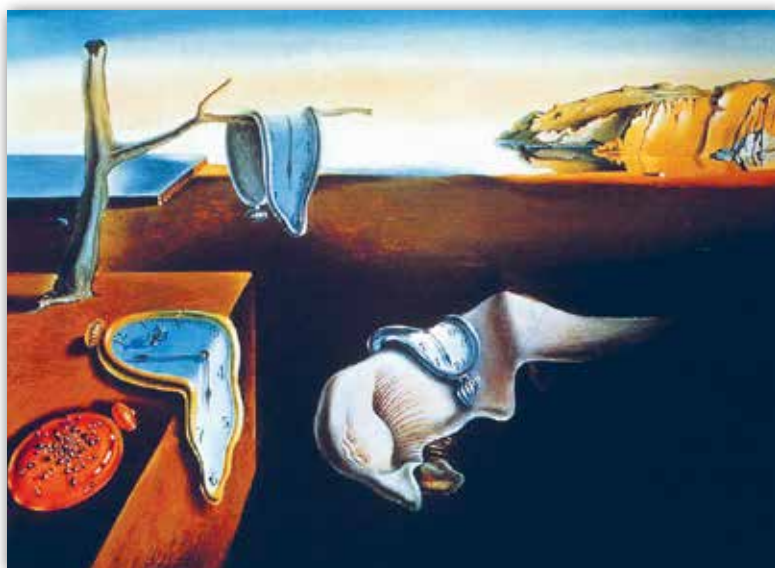
Сальвадор Далі. Нязменнасць памяці (Мяккі гадзіннік) (1930 г.)

У карціне « Нязменнасць памяці (Мяккі гадзіннік) » іспанскага мастака-сюррэаліста Сальвадора Далі на фоне пустыннага ўзбярэжжа і скал, ахутаных мяккім святлом вячэрняй зары, быццам знянацку з'яўляецца «расплаўлены гадзіннік». Ён нібы сцякае па паверхнях, нагадваючы аб цякучасці часу. Яркай