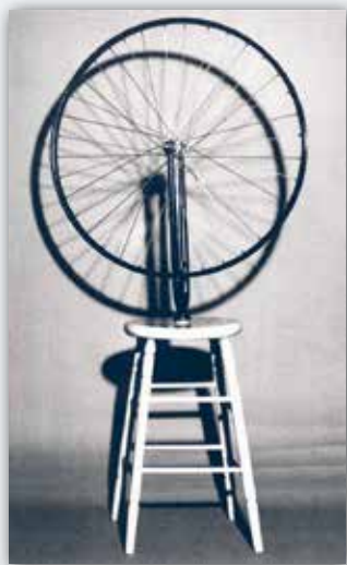
Марсэль Дзюшан. Веласіпеднае кола на табурэтцы (1913 г.)

якая «мастацкая тэхніка» атрымала назву « ready-made » (англ. — зробленае з гатовага, гатовыя прадметы). «Веласіпеднае кола на табурэтцы» — яркі прыклад мастацтва « ready-made ». У гульнявой форме мастак дэманструе значнасць вынаходкі чалавецтва, прапаноўваючы глядачу пранікнуцца майстэрствам стваральніка гэтага шэдэўра.