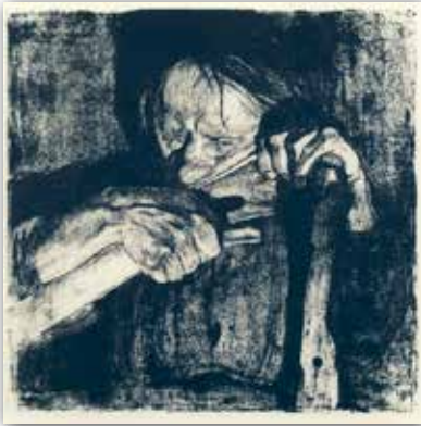
Кетэ Кольвіц. Афорт «За вастрэнным касы» з цыкла «Сялянская вайна» (1905 г.)

Экспрэсіянізм у выяўленчым мастацтве. Галоўнай тэмай у творчасці прадстаўнікоў экспрэсіянізму стаў лёс чалавека ў сучасным свеце, поўным несправядлівасці і жорсткасці. Мастакі-экспрэсіяністы паказвалі рэальную кар-