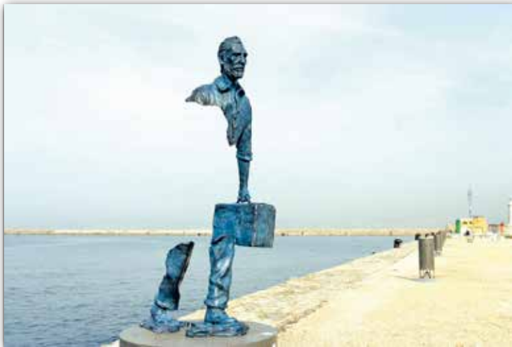
Бруна Каталана. Вялікі Ван Гог з серыі «Вандроўнікі (Падарожнікі)» (2013 г.)

Размытасць, няпоўная прапрацоўка формы вобраза з'яўляюцца галоўнымі характарыстыкамі манументальнай постаці вандроўніка ў скульптуры Бруна Каталана . Але менавіта прыём «сцірання» фігуры дазваляе святлопаветраным патокам свабодна праходзіць скрозь скульптуру. Нібы іншаземец, які ўзнік невядома адкуль, па марской роўнядзі ступае Ван Гог. Здаецца, што мастак з мінулага, сам не ўсведамляючы таго, крочыць скрозь стагоддзі, несучы чамадан з сакрэтамі свайго майстэрства будучым нашчадкам. Яго вобраз, як няпоўная праекцыя камп'ютарнай карцінкі, можа вось-вось знікнуць, пакінуўшы толькі ўспамін пра веліч творцы.