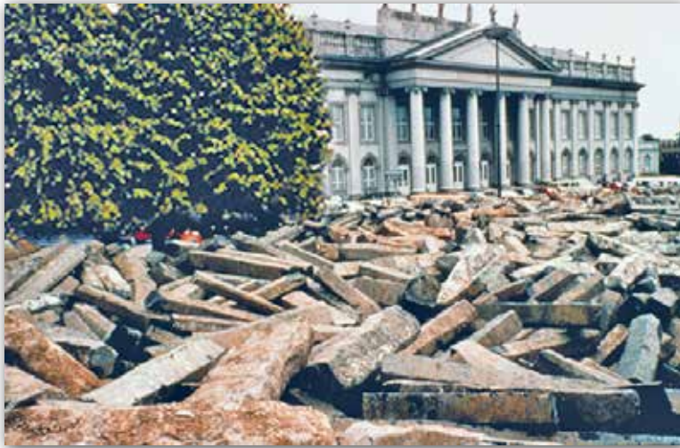
Ёзэф Бойс. 7000 дубоў (пачатак акцыі — 1982 г.)

Змяніць прастору, зірнуўшы на яе вачыма мастака, імкнуліся майстры інсталляцый (англ. installation — устаноўка, мантаж). Выкарыстоўваючы разнастайныя прадметы для трансфармацыі асяроддзя ў мастацкую прастору, яны змянялі свет згодна з патрабаваннямі часу. У адной кампазіцыі мастакі прымянялі розныя тэхнікі мастацтва — і жывапісныя, і графічныя, і пластычныя. Часам сумяшчаліся нават сродкі выразнасці няроднасных відаў мастацтва, напрыклад жывапісу і кіно.