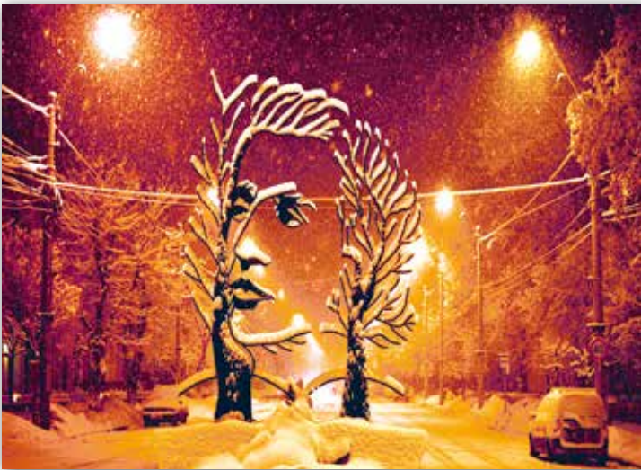
Эрэмія Грыгорску. Помнік паэту Міхаю Эмініску ў Анешці, Румынія (2000 г.)

Скульптура і асяроддзе: новыя формы дыялогу. Сваю звычайную форму паступова губляе і манументальная скульптура. Замест добра прапрацаванага сілуэта і адпаліраванай фактуры на гарадскіх плошчах, вуліцах, у парках «вырастаюць» невыразныя фігуры. Зліваючыся з навакольным асяроддзем, яны выглядаюць незвычайна, але ў той жа час неназойліва — быццам заўсёды былі яго арганічнай часткай.