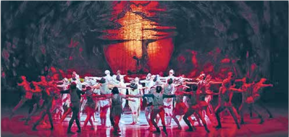
Композитор Карл Орф. Сцена из вокально-хореографического представления «Кармина Бурана» в постановке Большого театра Беларуси

О, судьба! Как луна, ты изменчива, Всегда то растёшь, То убываешь, Вмешиваешься в ход жизни... Из пролога «О, Фортуна!»