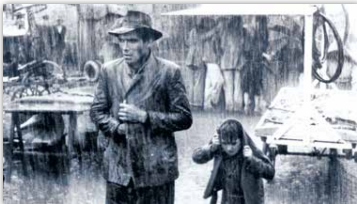
Режиссёр Витторио Де Сика. Кадр из кинофильма «Похитители велосипедов» (1948 г.)

История отца и сына заканчивается неопределённо. Оба героя, маленький и большой, не найдя велосипед, молча возвращаются домой. Режиссёр доверяет зрителю самому завершить историю и решить, что же произойдёт с героями дальше.