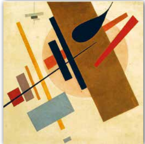
Казимир Малевич. Супрематизм (1915—1916 гг.)

В композициях К. Малевича с одноимённым названием «Супрематизм» обязательным становится светлый фон с «летающими» в невесомости одноцветными геометрическими фигурами. Из всего богатства геометрических форм художник останавливается на кресте и четырёхугольнике. Их сочетание в композиции порождает эффект движения. А фигуры, выполненные в ярких красках, позволяют сосредоточиться на главных средствах выразительности — цвете и форме.