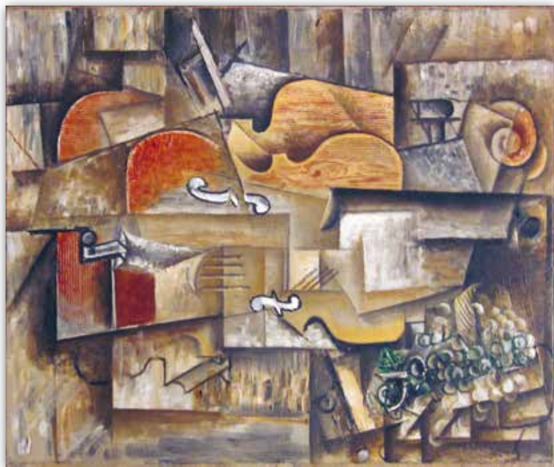
Пабло Пикассо. Скрипка и виноград (1912 г.)

В произведениях изобразительного искусства художник словно анализирует предметы, представляя их в виде собранных фрагментов. В каждом эпизоде его художественного опуса есть подсказка, каждая деталь содержит отличительные признаки изображаемого предмета. Например, в композиции «Скрипка и виноград» можно видеть части корпуса с характерной линией изгиба, обломки грифа, колки, струны. Они кажутся хаотично разбросанными по полотну. Но в этой неупорядоченной композиции кроется логика построения формы. Худож-