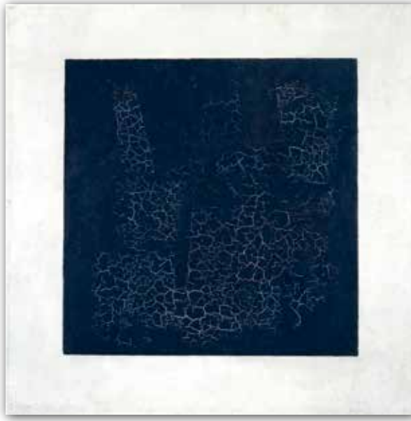
Казимир Малевич. Чёрный квадрат (1915 г.)

Живописцы должны не обращать внимания на сюжет и вещи, если хотят быть чистыми живописцами.