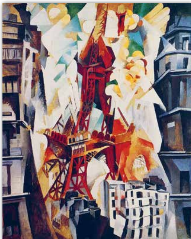
Робер Делоне. Эйфелева башня (1914 г.)

Взрыв формы: кубизм. Новое понимание художественной формы предложили мастера кубiзма . Чтобы окончательно уйти от реалистичности изображаемых объектов, кубисты намеренно деформировали их, прибегая к неординарным способам. Первые пробы в этом направлении выразились в придании