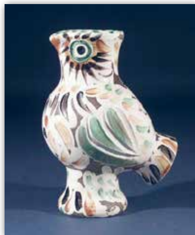
Пабло Пикассо. Сова (1968 г.)