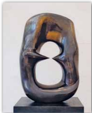
Генри Мур. Овал с точками (1968—1970 гг.)

3. Рассмотрите «Композицию VIII. № 260» В. Кандинского на с. 74. Определите главную точку схождения линий в перспективе. Какими средствами художник выделил центр композиции? Какое название вы дали бы этой работе? Какую картину реального мира она напоминает?