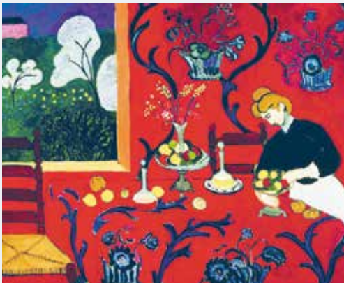
Анри Матисс. Красная комната (1908 г.)

Название художественного направления «фовизм» возникло после выставки работ художников в Осеннем салоне в 1905 году. На страницах журналов об искусстве появились заметки, в которых художников называли «дикими» (фр. fauve ).