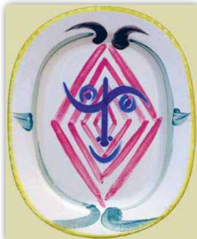
Пабло Пикассо. Голова Фавна (1948 г.)

Первое громкое слово в беспредметном искусстве сказал основоположник абстракционизма Василий Кандинский . Его нефигуративная живопись продолжила исследования «музыкального звучания» цвета. Работая в связке