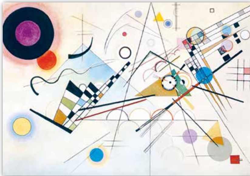
Василий Кандинский. Композиция VIII. № 260 (1923 г.)

с экспрессионистами, художник всё больше углублялся в изучение роли цвета в визуальном выражении формы, абстрагируясь от действительности. Постепенно из его художественных произведений исчезли изображения людей, животных и каких-либо предметов материального мира.