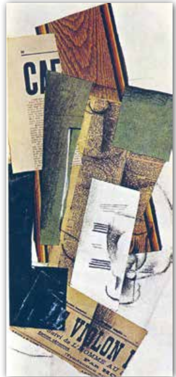
Жорж Брак. Стеклянный графин и газета (1914 г.)

Ориентируясь на восприятие неподготовленной публики, кубисты со временем стали намеренно включать в художественные произведения знакомые предметы. На живописные полотна они наклеивали вырезки из газет, поверх слоя масляной краски сыпали песок или приклеивали битое стекло. Этот приём получил название « коллэж » (фр. coller — клеить, приклеивать). В натюрморте « Стеклянный графин и газета » французский художник Жорж Брак использовал несколько техник, позволивших достичь сверхреальной передачи объёма изображения. Выполненная маслом на холсте композиция была дополнена коллажем и прорисовкой деталей углём. Именно коллаж с печатными текстами помог ощутить реальность запечатлённых предметов.