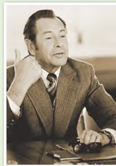
П. М. Машеров

После войны, навещая могилу матери, Машеров уходил спиной вперед, а лицом к памятнику, потому что не мог отвернуться. После войны был избран первым секретарем Центрального комитета Ленинского коммунистического союза молодежи Беларуси. Пользовался большим уважением среди населения за человечность, доступность, демократичность. Однажды, навещая тяжело больного К. П. Орловского, П. М. Машеров опустился возле него на колени и спросил, почему он лежит в темноте. На следующий день по его распоряжению провели свет на улице, где жил знаменитый председатель колхоза. В период деятельности П. М. Машерова БССР достигла значительных успехов в создании индустриального потенциала, стала одной из высокоразвитых республик СССР, а сам Машеров был награжден звездой Героя Социалистического Труда.