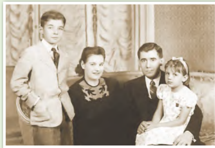
А. А. Громыко с семьей. 1940-е гг.

**2. Руководителем советской делегации на конференциях по созданию Организации Объединенных Наций и принятию ее Устава был уроженец Гомельщины Андрей Андреевич Громыко (1909—1989). В 1946—1948 гг. — постоянный представитель СССР в Совете Безопасности ООН. Ему принадлежит важная роль в решении вопроса о включении БССР в состав государств — основателей ООН, а его подпись стоит под Уставом ООН. С конца 1940-х гг. А. А. Громыко более 20 раз в интересах СССР использовал право вето (голосования против) в Совете Безопасности ООН. За это получил в западной дипломатической среде, а затем и в прессе имя «Мистер Нет». Громыко относился к такому прозвищу добродушно. Как-то он сказал: «Мои „нет“ они слышали намного реже, чем я их „ноу“, ведь мы выдвигали гораздо больше предложений». В 1957—1985 гг. А. А. Громыко являлся министром иностранных дел СССР. Работая в этой должности, заявлял: «Я собой манипулировать не позволял. Кто стремился к этому, хотел манипулировать СССР. Мы — великая держава и никому этого делать не позволим!» А. А. Громыко придерживался мнения, что лучше десять лет переговоров, чем один день войны. В Гомеле установлен бюст нашего знаменитого земляка, а его важнейшие дипломатические принципы составляют ядро современной внешней политики Республики Беларусь.