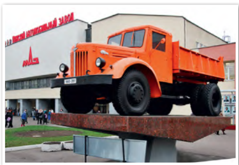
Памятник первому самосвалу МАЗ-205 возле Минского автомобильного завода