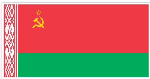
Государственный флаг БССР в 1951—1991 гг.

В послевоенное время в Беларуси в государственной политике более заметными стали тенденции веротерпимости. Это проявилось в увеличении количества православных приходов, церквей и священников. Восстановление церковной жизни стало возможным благодаря участию священников в борьбе с врагом во время Великой Отечественной войны.