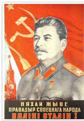
Советский плакат. Художники Е. Н. Тарас, Н. Т. Гутиев, Л. П. Замах. 1950 г.