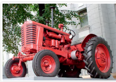
Трактор-памятник «Беларусь» возле Минского тракторного завода

В сентябре 1946 г. Верховный Совет БССР принял «Закон о пятилетнем плане восстановления и развития народного хозяйства республики на 1946–1950 гг.», который являлся составляющей общесоюзного плана. Правительство СССР выделило значительные денежные средства на восстановление народного хозяйства Беларуси и помощь населению.