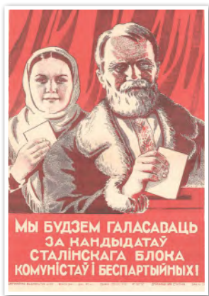
Советский плакат. Художник Л. П. Замах. 1946 г.