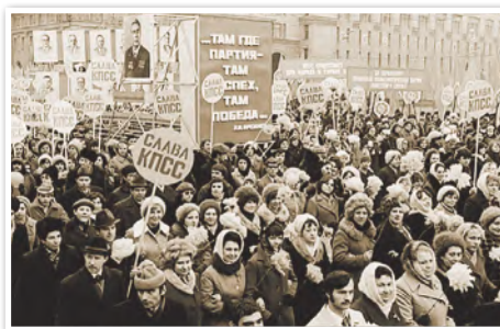
Демонстрация трудящихся города Минска. Фотография 1976 г.

В БССР, так же как и в других советских республиках, регулярно организовывались массовые собрания, митинги, грандиозные уличные шествия, посвященные празднованию дней Октябрьской революции и Первого мая, Победы и освобождения БССР от немецко-фашистских захватчиков. С большой торжественностью отмечались ленинские дни, знаменательные даты в истории КПСС, выборы в Советы народных депутатов, принятие новой Конституции СССР 1977 г. и Конституции БССР 1978 г.