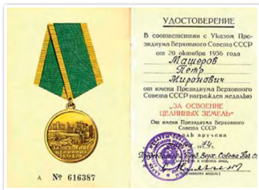
Свидетельство к медали «За освоение целинных земель»

В начале 1960-х гг. произошло ухудшение положения в сельском хозяйстве. На его развитии отрицательно сказалась позиция партийного и государственного руководителя СССР того времени Н. С. Хрущёва. При нем во всех районах БССР, независимо от их природно-климатических условий, заставляли выращивать кукурузу. Также в хозяйствах вследствие механизации значительно сократилось количество лошадей. Отрицательным