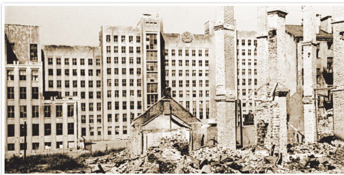
Минск. Руины на площади Ленина (сейчас площадь Независимости). 1945 г.

Преодоление последствий войны в области экономики. Курс на опережающий рост тяжелой промышленности. В результате военных разрушений и преступлений германских захватчиков белорусский народ лишился более половины национального богатства. Были сожжены и разорены более 200 городов и городских поселков, свыше 9 тысяч деревень. Когда войска Красной Армии 26 июня 1944 г. освободили Витебск, в городе осталось всего 118 жителей, а до войны их было не менее 180 тысяч. Промышленные предприятия и белорусская железная дорога были почти полностью уничтожены. По воспоминаниям минчан, в центральных районах города после освобождения от немецко-фашистских оккупантов осталось всего около 70 неразрушенных зданий. В их числе — Дом правительства, Дом Красной Армии, Театр оперы и балета, построенные в довоенное время по проектам архитектора И. Лангбарда. Вставал даже вопрос о переносе столицы БССР в Могилев.