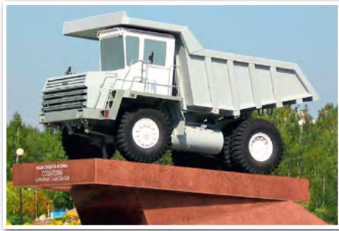
Памятник создателям самосвалов около завода БелАЗ в Жодино

производство минеральных удобрений. Были построены 1-й и 2-й Солигорские калийные комбинаты, Гомельский суперфосфатный и Гродненский азотно-туковый заводы. Была получена первая промышленная нефть в районе Речицы, но запасы ее оказались небольшими. Поэтому собственная нефть обеспечивала потребности БССР не более чем на 10%. Остальная часть необходимой нефти, а также природный газ поставлялись из России по трубопроводам, которые через Беларусь шли в страны Европы. С учетом этого в БССР был построен ряд крупных нефтехимических предприятий. Среди них — нефтеперерабатывающий завод и химический комбинат в Новополоцке, Светлогорский завод искусственного волокна. В 1965 г. выпуск продукции химической и нефтехимической промышленности в республике увеличился по сравнению с 1950 г. в 27 раз.