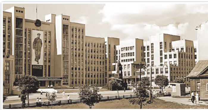
Дом Правительства в Минске. Фотография 1938 г.

Одним из основателей белорусской советской архитектуры стал Иосиф Лангбард. По его проектам в Минске были построены Дом Правительства, Дом Красной Армии, главный корпус Академии наук БССР, Белорусский государственный театр оперы и балета. Девятиэтажное здание Дома Правительства возводилось без привычных теперь подъемных кранов. Рядом с Домом Правительства был установлен памятник В. И. Ленину. По проекту И. Лангбарда построен Дом Советов в Могилеве, внешне похожий на Дом Правительства в Минске. Это было связано с обсуждением вопроса о переносе столицы республики из Минска в Могилев по причине близости границы с Польшей.