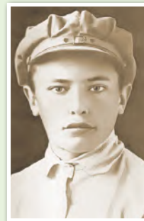
А. Кулешов. Фотография 1927 г.

В начале 1970-х гг. белорусский композитор Игорь Лученок написал музыку на стихотворение А. Кулешова «Прощай...». Так появилась песня «Алесь», вошедшая в репертуар белорусского ансамбля «Песняры» и ставшая очень популярной.