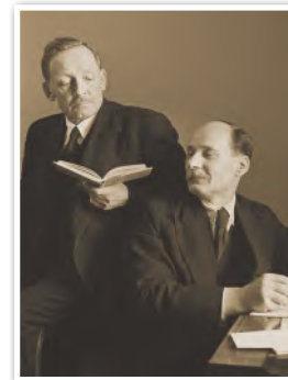
Я. Купала и Я. Колас. Фотография 1938 г.

Во время политических репрессий народному поэту Янке Купале была приписана роль главы «Союза освобождения Беларуси», которого вообще не существовало. Поэт не дал возможности спротоцировать себя. Вернувшись домой после очередного допроса, он совершил попытку самоубийства. «Лучше смерть физическая, чем политическая», — писал он в письме к А. Г. Червякову.