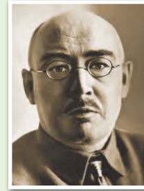
В. М. Игнатовский

Всеволод Макарович Игнатовский (1881—1931). Уроженец Брестского уезда (ныне Камянецкий район Брестской области). Белорусский историк и общественный деятель. В 1920—1926 гг. являлся первым в истории Советской Беларуси народным комиссаром просвещения БССР. Автор книги «Краткий очерк истории Беларуси», на протяжении долгого времени являвшейся школьным учебником. В. М. Игнатовский стал жертвой репрессий за то, что якобы в своей научной деятельности на первое место ставил национальные, а не классовые вопросы. Не выдержав издевательств и в знак протеста против необоснованных обвинений после одного из допросов застрелился.