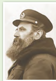
О. Ю. Шмидт

**3. Отто Юльевич Шмидт (1891—1956). Уроженец Могилева. Советский математик, астроном. В начале 1930-х гг. возглавлял арктические экспедиции на Северном морском пути. Во время одной из них ледокол «Челюскин» был раздавлен льдами. Участники экспедиции высадились на льдине, где мужественно и без паники жили два месяца в палатках. Спасли «челюскинцев» летчики. Им было впервые присвоено звание Героя Советского Союза. Такого же звания был удостоен О. Ю. Шмидт. При его участии в 1937 г. была открыта первая в мире дрейфующая научная станция «Северный полюс-1». Он успешно занимался изучением космического пространства, разработал теорию происхождения Земли и планет Солнечной системы из веществ холодного газопылевого облака.