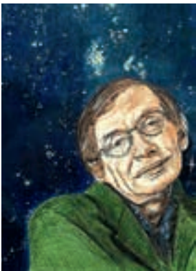
Фрагмент вокладкі графічнага рамана пра жыццё С. Хокінга

Сусветна вядомаму фізіку-тэарэтыку Стывену Хокінгу ў дваццаць адзін год паставілі дыягназ, што гучаў як смяротны прысуд. Урачы давалі маладому чалавеку не больш за тры гады жыцця.