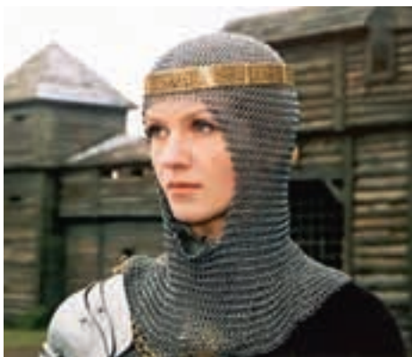
Кадр из фильма «Анастасия Слуцкая» киностудии «Беларусьфильм» (реж. Ю. Елхов, 2003 г.)

По большому счёту, представители элитарной культуры не ставят перед собой цели быть понятыми извне. Поэтому говорят о ценностно-смысловой самодостаточности элитарной культуры, которая опережает уровень её восприятия большинством людей.