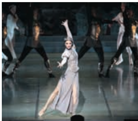
Фрагмент балета «Анастасия» Национального академического Большого театра оперы и балета Республики Беларусь (постановка 2018 г.)

В чём, на ваш взгляд, состоят особенности представления сюжета и его восприятия зрителями в игровом фильме и в балете? Почему балет относится к элитарной культуре? ■