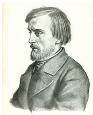
В. Г. Белинский

Первым профессиональным критиком считается Виссарион Григорьевич Белинский (1811—1848). Он в своих работах объяснил суть реализма как художественной системы, выделил его отличительные черты: историзм, народность, типизацию. Белинский рассматривал литературу как важнейшее орудие социальной борьбы. Такая позиция обусловлена не только индивидуальными взглядами критика, но и историческими обстоятельствами, которые их сформировали. Роль В. Г. Белинского для русской литературы часто сравнивают со значением творчества А. С. Пушкина.