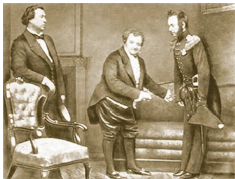
Постановка «Горе от ума» в Малом театре в 1852 году

В 1830 году цензура разрешила к представлению лишь отдельные сцены из пьесы, что стало важным событием в жизни Малого театра, а в 1831 году театральная Москва впервые увидела её целиком. В спектакле принимали участие два великих мастера московской сцены: М. С. Щепкин — в роли Фамусова и П. С. Мочалов — в роли Чацкого.