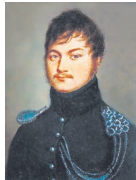
С. Н. Бегичев

Судьбу Грибоедова сильно изменил 1812 год. «Находясь в звании кандидата прав Московского университета, я был готов к испытанию для поступления в чин доктора, как получено было известие о вторжении неприятеля в пределы отечества нашего... Я решил тогда оставить все занятия мои и поступить на военную службу...» — писал сам А. С. Грибоедов, который стал офицером Московского гусарского полка в сентябре 1812 года. В сражениях участия он не принимал: полк не успели укомплектовать и срочно выслали из Москвы в тыл. Однако именно в армии он подружился с С. Н. Бегичевым, чьё нравственное влияние ощущал потом всю жизнь. Грибоедов писал другу: «Ты, мой друг, поселил в меня любовь к добру, я с тех пор только начал дорожить честностью и всем тем, что составляет истинную красоту души, с того времени... когда с тобою побываю вместе, становлюсь нравственно лучше, добрее». А. С. Грибоедов признавался, что Бегичев заставил его всерьёз размышлять о современном состоянии России, крепостном праве, войне с Наполеоном.