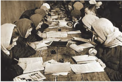
Школа пісьменнасці. Кожны населены пункт, дзе было звыш 15 непісьменных, павінен быў мець школу пісьменнасці (лікпункт)