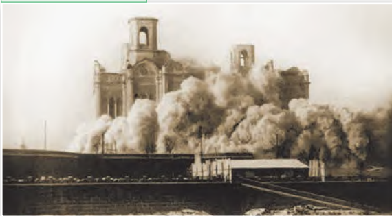
Храм Хрыста Збавіцеля, пабудаваны ў гонар перамогі і ў памяць аб тых, хто загінуў у Айчыннай вайне 1812 г. Быў разбураны 5 снежня 1931 г. Адноўлены ў 1990-я гг.

Дон»), М. Шагінян («Гідрацэнтраль»), В. Катаева («Час, наперад!»), пісьменнікаў-сатырыкаў І. Льфа і Я. Пятрова («Дванаццаць крэслаў», «Залатое цяля»). Сфарміравалася савецкая дзіцячая літаратура ( С. Маршак , К. Чукоўскі , А. Гайдар , Б. Жыткоў ).