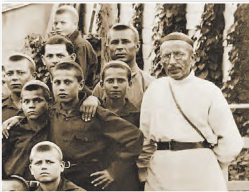
Знакаміты савецкі педагог А. С. Макаранка з выхаванцамі. Адыграў вялікую ролю ў барацьбе з дзіцячай беспрытульнасцю ў 1920-я гг. Праз камуны, арганізаваныя А. С. Макаранкам, прайшло больш за 3 тыс. беспрытульнікаў