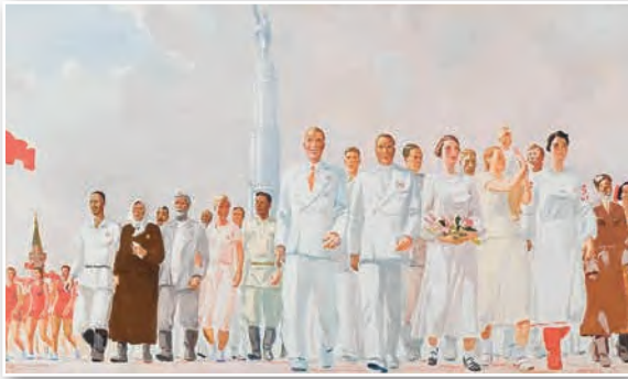
А. Дайнека. Знатныя людзі краіны Саветаў. Пано для павільёна СССР на Сусветнай выставе ў Парыжы. 1937 г.

ўвага. Галоўнымі тэмамі кіно былі жыццё савецкіх людзей і іх удзел у рэвалюцыйных падзеях («Браняносец „Пацёмкін“», «Кастрычнік» С. Эйзенштэйна , «Ленін у Кастрычніку» і «Ленін у 1918 г.» М. Рома ), Грамадзянскай вайне («Мы з Кранштата» Я. Дзігана , «Чапаеў» С. і Р. Васільевых ), індустрыялізацыі і калектывізацыі («Сямёра смелых» і «Камсамольск» С. Герасімава ). Многія члены ЦК ВКП (б), у тым ліку І. В. Сталін, асабіста праглядалі фільмы і былі іх цензарамі. Шэраг мастацкіх твораў так і не дайшоў да чытача і гледача (раманы М. Булгакава і А. Платонава , карціны К. Малевіча і інш.).