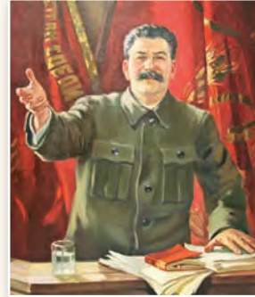
Выступленне І. В. Сталіна на XVIII з’ездзе ВКП (б). Мастак А. Герасімаў. 1939 г.

Якую ролю ў палітычнай сістэме Савецкага Саюза адыгрывала партыя бальшавікоў? Растлумачце, як адбывалася зрошчванне партыйнага і дзяржаўнага апарату.