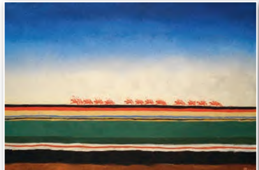
К. Малевіч. Скача чырвоная конніца. 1928—1932 гг.

У літаратуры 1930-х гг. побач з імёнамі, вядомымі да рэвалюцыі ( М. Горкі , А. Талстой і інш.), з'явіліся новыя — М. Шалахава («Ціхі