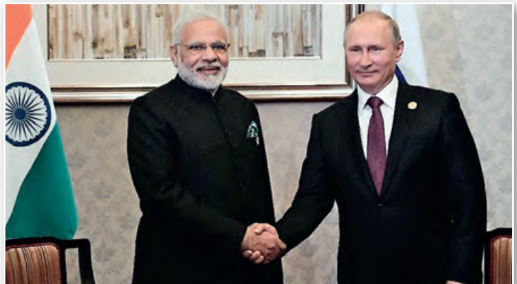
На перагаворах прэм'ер-міністра Індыі Нарэндры Модзі з Прэзідэнтам Расіі Уладзімірам Пуціным. 21 мая 2018 г.

Новая адміністрацыя павяла рашучую барацьбу супраць розных праяў сепаратызму як галоўнай пагрозы тэрытарыяльнай цэласнасці Расіі. У шэрагу суб'ектаў Расійскай Федэрацыі былі адменены заканадаўчыя акты, якія супярэчылі Канстытуцыі. Заслугай У. У. Пуціна стала канчатковае ўрэгуляванне чачэнскага канфлікту ў 2004 г.