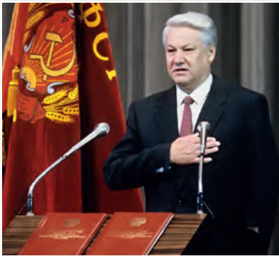
Інаўгурацыя Прэзідэнта РСФСР Б. М. Ельцына. 1991 г.

Важнымі крокамі на шляху пабудовы новай дзяржаўнасці сталі прыняцце Дэкларацыі аб дзяржаўным суверэнітэце РСФСР , якое адбылося 12 чэрвеня 1990 г., і ўвядзенне пасады прэзідэнта РСФСР, які выбіраўся ўсенародна. Уся паўната суверэнітэту цяпер належала Расіі ў асобе яе найвышэйшых дзяржаўных органаў. Першым Прэзідэнтам РСФСР 12 чэрвеня 1991 г. быў абраны Б. М. Ельцын. Расія