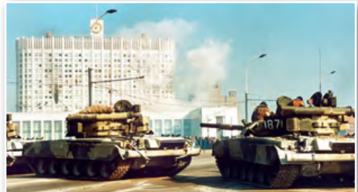
Танкі абстрэльваюць будынак Вярхоўнага Савета Расіі. Масква. Кастрычнік 1993 г.

Якія вынікі мела радыкальная эканамічная рэформа пачатку 1990-х гг.?