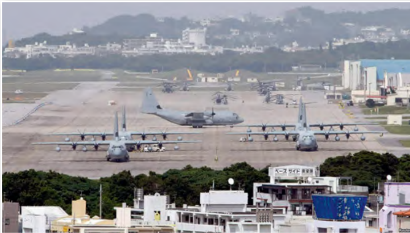
Ваенная база ЗША на востраве Акінава

Буйныя манаполіі (дзайбацу) былі распушчаны, раздроблены на дзясяткі кампаній, іх аперацыі апынуліся пад амерыканскім кантролем. Такім чынам, ЗША аслаблялі свайго асноўнага гандлёва-прамысловага канкурэнта ва Усходняй Азіі.