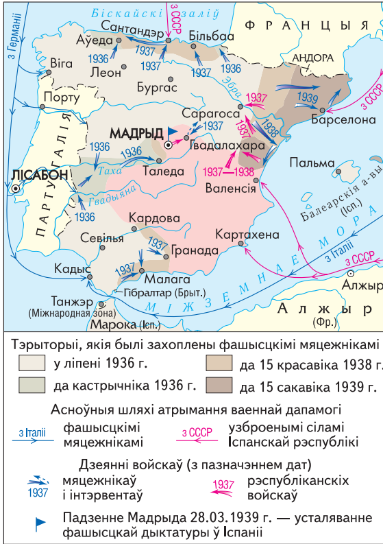
Грамадзянская вайна ў Іспаніі (1936—1939)