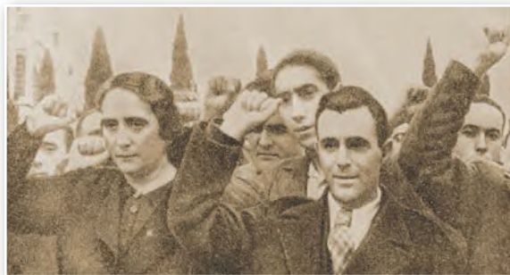
Лідары Камуністычнай партыі Іспаніі Далорэс Ібаруры і Хасэ Дыяс. 1936 г. Інтэрнацыянальнае прывітанне «Рот фронт» і лозунг «Но пасаран» («Яны не пройдуць») сталі сімваламі барацьбы з фашызмам

Прыход фашыстаў да ўлады ў Германіі, узмацненне фашызму ў Еўропе вымусілі VII кангрэс Камінтэрна летам 1935 г. зацвердзіць новую стратэгію камуністычнага руху — стварэнне адзінага антыфашысцкага Народнага фронту. Ён павінен быў злучыць ідэалагічна разнастайныя сілы, аб'яднаныя непрыманням фашызму. Гэта рашэнне Камінтэрна спрыяла супраціву фашызму ў міжнародным маштабе.