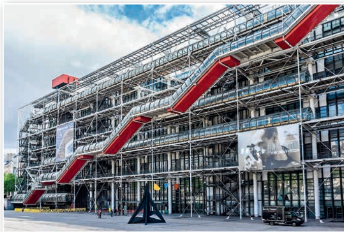
Национальный центр искусства и культуры имени Ж. Помпиду. Центр Помпиду включает в себя музей современного искусства, библиотеку, Центр промышленного дизайна, Институт исследования и координации акустики и музыки, концертные и выставочные залы, несколько кинозалов

Составьте список из 10 выдающихся архитектурных сооружений второй половины XX — начала XXI в. Объясните свой выбор.