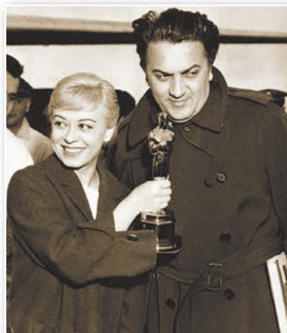
Джульетта Мазина и Федерико Феллини с премией «Оскар» за фильм «Дорога». 1957 г.

В итальянском киноискусстве возникло новое прогрессивное направление — неореализм . Фильмы неореалистического направления основывались на документальных фактах. Съемки были натуральными,