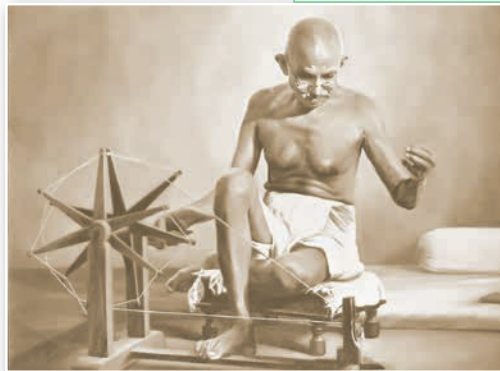
Махатма Ганди за прядкой. Прядильное колесо было изображено на флаге ИНК, который стал основой для государственного флага Индии

С 12 марта по 5 апреля Махатма Ганди вместе со своими последователями прошел пешком почти 400 км до побережья Аравийского моря. Здесь на одном из приисков участники похода начали демонстративно выпаривать соль из морской воды. Подняв