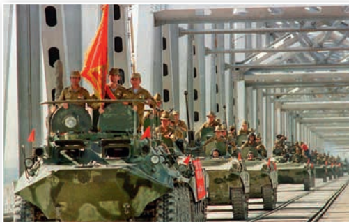
Вывод советских войск из Афганистана. 1989 г.

полностью выведены из Афганистана. С согласия СССР была объединена Германия. Затем советское руководство согласилось вывести свои войска из объединенной Германии, которая вступала в НАТО. СССР занял позицию невмешательства в процессы, которые привели к падению социалистических режимов и власти компартий в соцстранах. В 1991 г. были распущены СЭВ и ОВД без всяких ответных шагов со стороны Североатлантического блока.