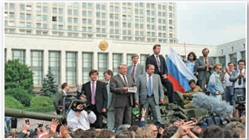
Выступление Б. Н. Ельцина перед демонстрантами в период августовского политического кризиса 1991 г.

25 декабря 1991 г. Горбачев сложил полномочия Президента СССР. Советское государство прекратило свое существование.