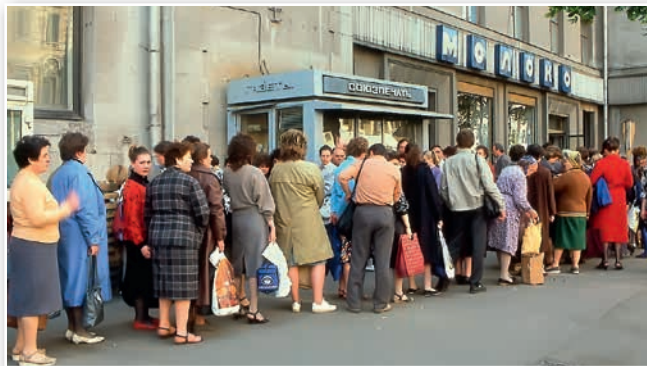
Очередь в продуктовый магазин в Москве. Конец 1980-х гг.

искало выход из создавшегося положения. Перед ним стояла альтернатива: или ограниченная политика типа нэпа, или централизованное командное управление с опорой на государственную собственность и подавление частной инициативы.