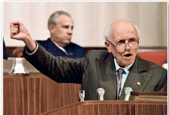
А. Д. Сахаров выступает на I Съезде народных депутатов СССР. Москва. 1989 г.

В это же время СССР все чаще делал односторонние уступки западным странам. В 1989 г. советские войска были