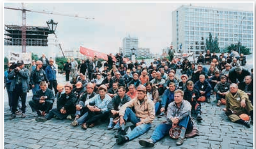
Первая крупная шахтерская забастовка Кузбасса. Междуреченск. Июль 1989 г.

Кризис 1980-х гг. К середине 1980-х гг. в СССР все заметнее стали кризисные явления: спад производства, продовольственные трудности, дефицит товаров. Административно-командное плановое управление не могло обеспечить дальнейшего развития экономики в условиях НТР. СССР терял доходы из-за падения цен на нефть и гонки вооружений, конкурируя с высокоразвитыми индустриальными государствами, сплотившимися вокруг США. Отчуждение человека от собственности, уравнивание в зарплате порождали недовольство. Большинство людей перестали верить в провозглашаемые идеалы социальной справедливости на фоне роста благосостояния многих представителей власти. Начиная с конца 1980-х гг. правительство