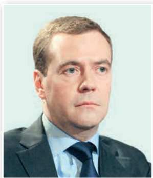
Д. А. Медведев

Внутренняя и внешняя политика РФ не изменилась и после избрания в 2008 г. Президентом Д. А. Медведева . В 2012 и 2018 гг. Президентом страны вновь был избран В. В. Путин.