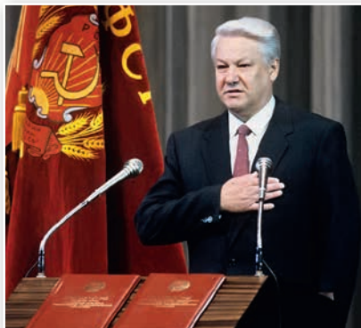
Инаугурация Президента РСФСР Б. Н. Ельцина. 1991 г.

Важными шагами на пути построения новой государственности стали принятие Декларации о государственном суверенитете РСФСР , которое состоялось 12 июня 1990 г., и учреждение должности всенародно избираемого президента РСФСР. Вся полнота суверенитета теперь принадлежала России в лице ее высших государственных органов. Первым Президентом РСФСР 12 июня 1991 г. был избран