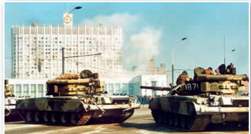
Танки обстреливают здание Верховного Совета России. Москва. Октябрь 1993 г.

Какие результаты имела радикальная экономическая реформа начала 1990-х гг.?