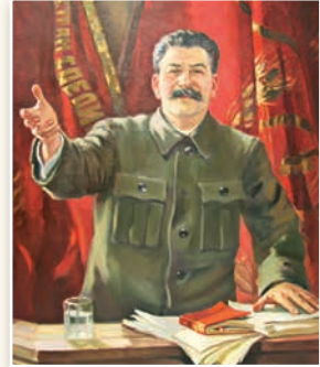
Выступление И. В. Сталина на XVIII съезде ВКП(б). Художник А. Герасимов. 1939 г.

Какую роль в политической системе Советского Союза играла партия большевиков? Объясните, как происходило сращивание партийного и государственного аппарата.