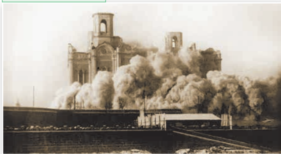
Храм Христа Спасителя, возведенный в честь победы и в память о павших в Отечественной войне 1812 г., был разрушен 5 декабря 1931 г. Восстановлен в 1990-е гг.