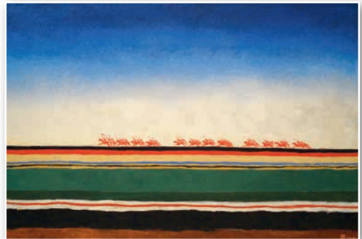
К. Малевич. Скачет красная конница. 1928—1932 гг.

В литературе 1930-х гг. наряду с именами, известными до революции ( М. Горький , А. Толстой и др.), появились новые — М. Шолохова («Тихий Дон»), М. Шагинян («Гидроцентральный»), В. Катаева («Время, вперед!»),