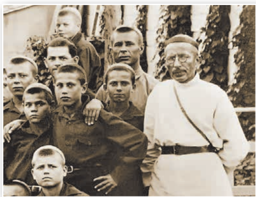
Знаменитый советский педагог А. С. Макаренко с воспитанниками. Сыграл большую роль в борьбе с детской беспризорностью в 1920-е гг. Через коммуны, организованные А. С. Макаренко, прошло более 3 тыс. беспризорников

По всей стране были открыты тысячи школ и пунктов по обучению грамоте. Чтению, счету, письму обучали как детей, так и взрослых. Борьба за ликвидацию неграмотности дала внушительный результат. К 1939 г. 80 % населения СССР умели читать, писать и считать.