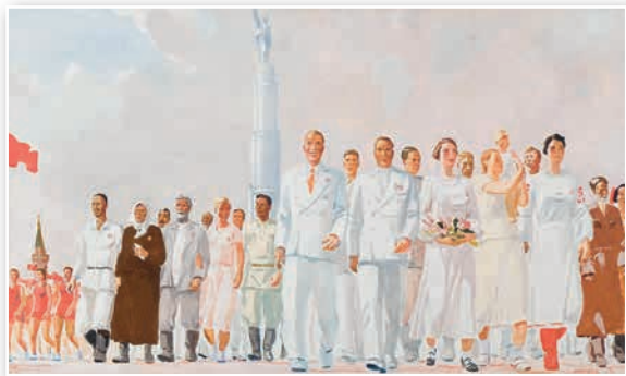
А. Дейнека. Знатные люди страны Советов. Панно для павильона СССР на Всемирной выставке в Париже. 1937 г.

участие в революционных событиях («Броненосец „Потёмкин“», «Октябрь» С. Эйзенштейна, «Ленин в Октябре» и «Ленин в 1918 г.» М. Ромма), Гражданской войне («Мы из Кронштадта» Е. Дзигана, «Чапаев» С. и Г. Васильевых), индустриализации и коллективизации («Семеро смелых» и «Комсомольск» С. Герасимовой). Многие члены ЦК ВКП(б), в том числе И. В. Сталин, лично просматривали фильмы и были их цензорами. Ряд художественных произведений так и не дошел до читателя и зрителя (романы М. Булгакова и А. Платонова, картины К. Малевича и др.).