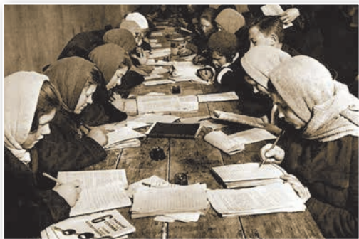
Школа грамотности. Каждый населенный пункт, где было свыше 15 неграмотных, должен был иметь школу грамотности (ликпункт)